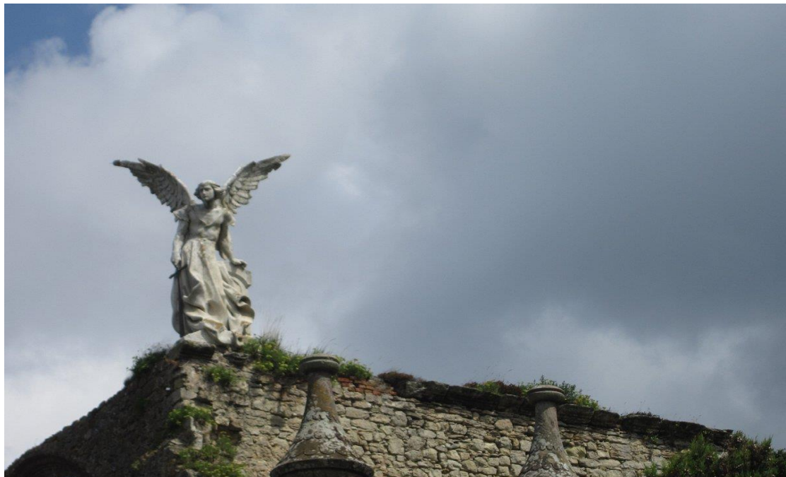
Cementerio de Comillas