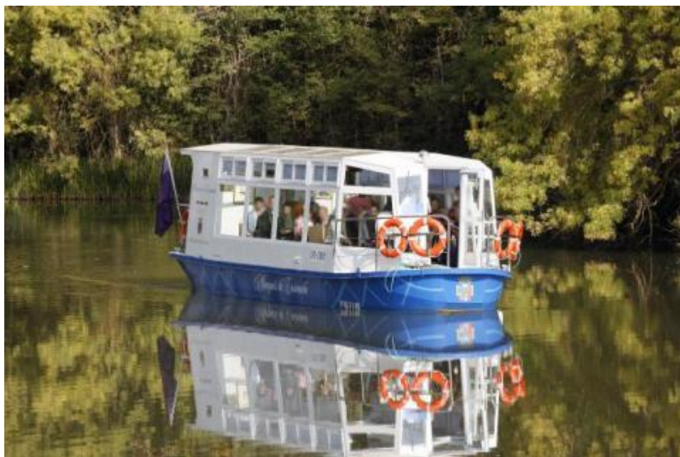
Canal de Castilla

A la tarde cogemos el barco para hacer una travesía en el canal de Castilla, con sus esclusas.