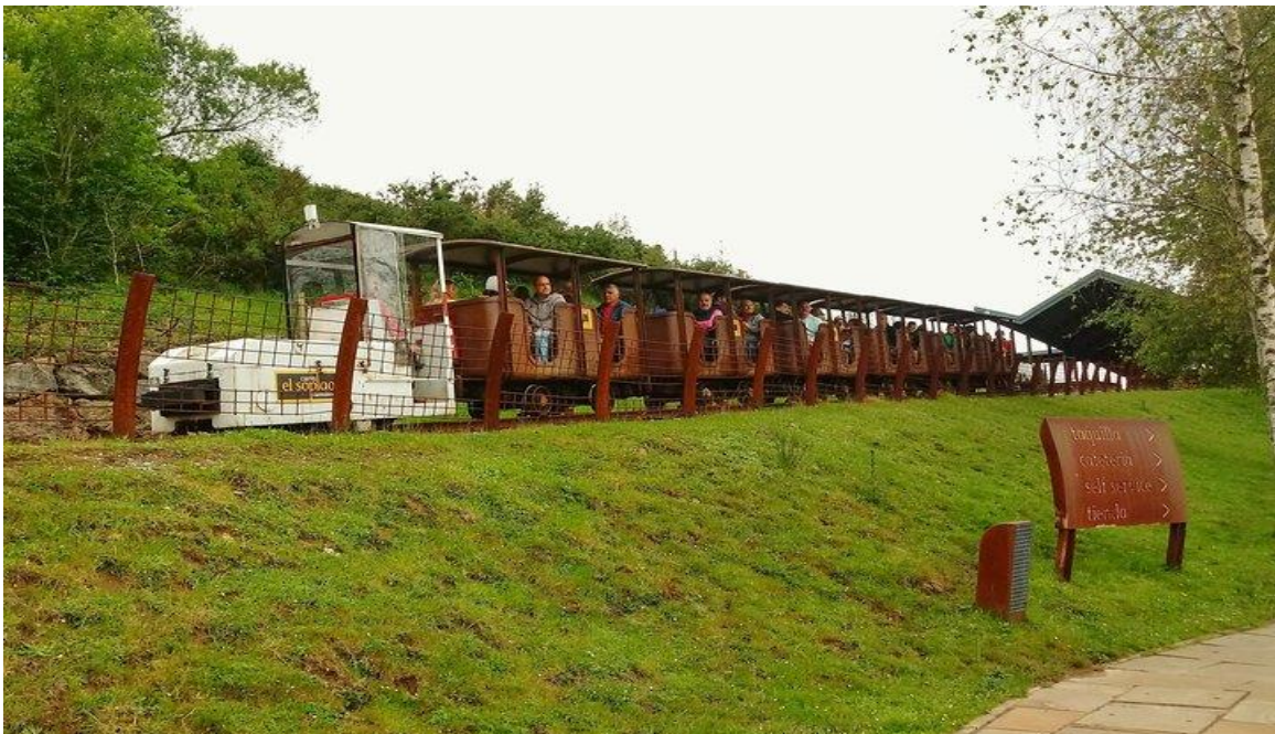
Cuevas del Soplo, tren para entrar en las cuevas