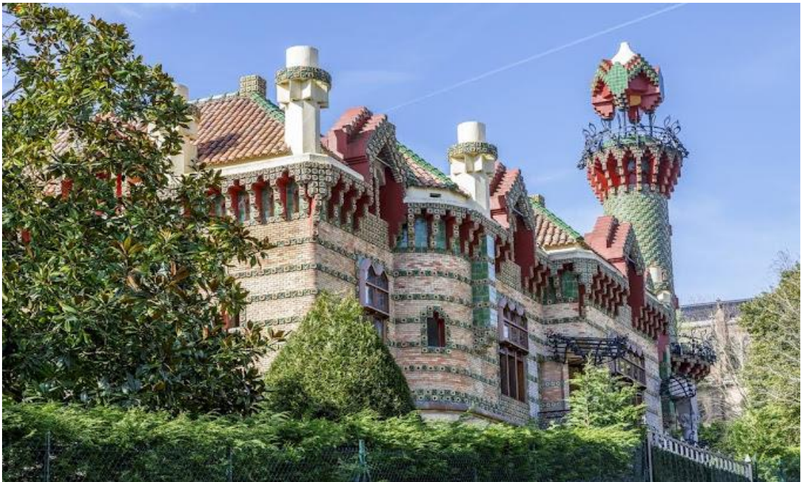
Capricho de Gaudí

Después visitaremos la localidad de Comillas y el Capricho de Gaudí con guía para que nos expliquen con detalle.